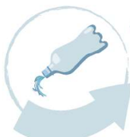
Goliți și clătiți recipientele