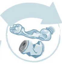
Pliati sau turtiți