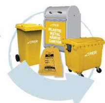
Depozitați-le în recipientul corespunzător