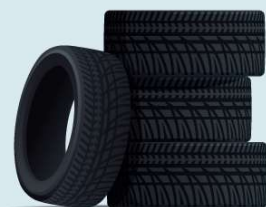
3. Anvelope uzate și vehicule scoase din uz