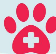
6. Deșeuri veterinare