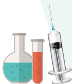
4. Deșeuri medicale