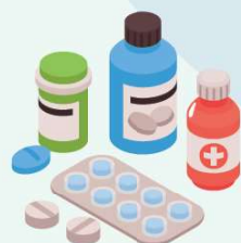
5. Medicamente expirate