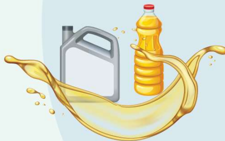
2. Ulei de motor sau orice alt tip de ulei uzat alimentar și nealimentar