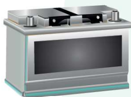
1. Baterii auto

Nu colectăm de la populație sau de la agenții economici următoarele tipuri de deșeuri: