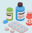
5. Medicamente expirate