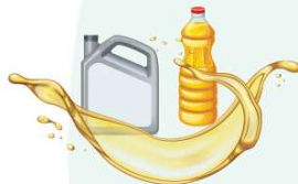
2. Ulei de motor sau orice alt tip de ulei uzat alimentar și nealimentar