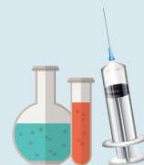
4. Deșuri medicale